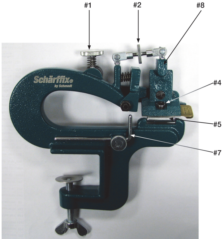
Abbildung – Illustration – Illustration – Ilustración - Avbildning